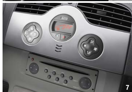
6-7. BILSTEREO CD MP3 med separat display

Frontalkrockkuddar med programmerad uppblåsning. Sidokrockkuddar och sidokrockgardiner.